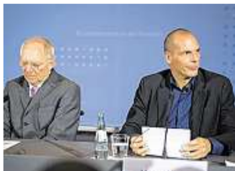
Keine Einigkeit: die Finanzminister Wolfgang Schäuble (l.) und Yanis Varoufakis.

Die Börse in Athen hatte gestern zunächst heftig auf die Entscheidung der obersten Notenbanker vom Vorabend reagiert. Der Leitindex brach zeitweise um mehr als neun Prozent ein. Im Laufe des Tages erholte sich der Index allerdings wieder. Kommentar und Porträt S. 2-Bericht S. 3