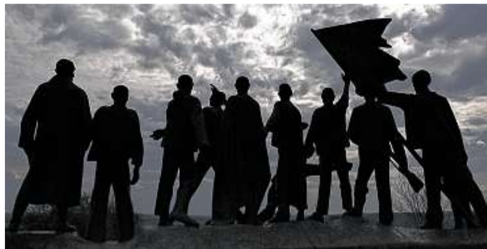
Das Widerstandsdenkmal an der Gedenkstätte Buchenwald.

Am Vormittag hatten Familienangehörige von Häftlingen aus Deutschland, Polen und Frankreich zwölf Bäume in der Nähe der einstigen „Blutstraße“ gepflanzt. Mit der Aktion „1000 Buchen“ wollen sie sich einen Ort des Erinnerns und Gedenkens schaffen. Über die „Blutstraße“ trieb und karrte die SS einst die Häftlinge in das Lager.